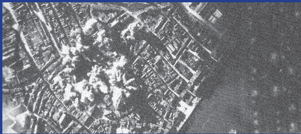
Nijmegen, seconden na de inslag van de eerste bommen

Op die foto zie je, heel klein en gemarkeerd door hardzwarte cirkels, enkele groepjes bommen in de lucht hangen, op weg naar Nijmegen. De natuurkundige wetten beschrijven dat die bommen vervolgens een parabolbaan gaan volgen om ruim 30 seconden later ruim 4 km verderop in te slaan, waarna een explosie volgt. Weer een andere foto is gemaakt op het moment dat de bommenwerpers boven de stad vliegen, de lucht is helder en centraal in de foto zie je een groep grijze straalvormige vlekken, het gevolg van de dan exploderende bommen. Tussen beide momenten in ontploffen de bommen en wordt Nijmegen dodelijk in het hart geraakt. Op weer andere foto's, op de begane grond genomen, zie je de stad na de explosies: verwoesting, chaos en ontredning.