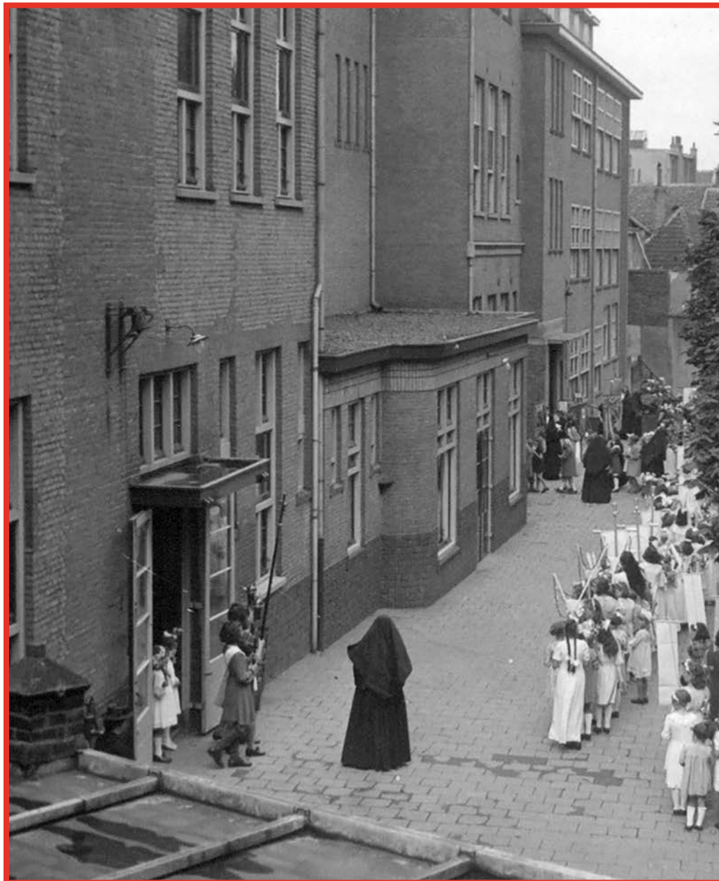
Bomen op speelplaats bij internaat St Louis