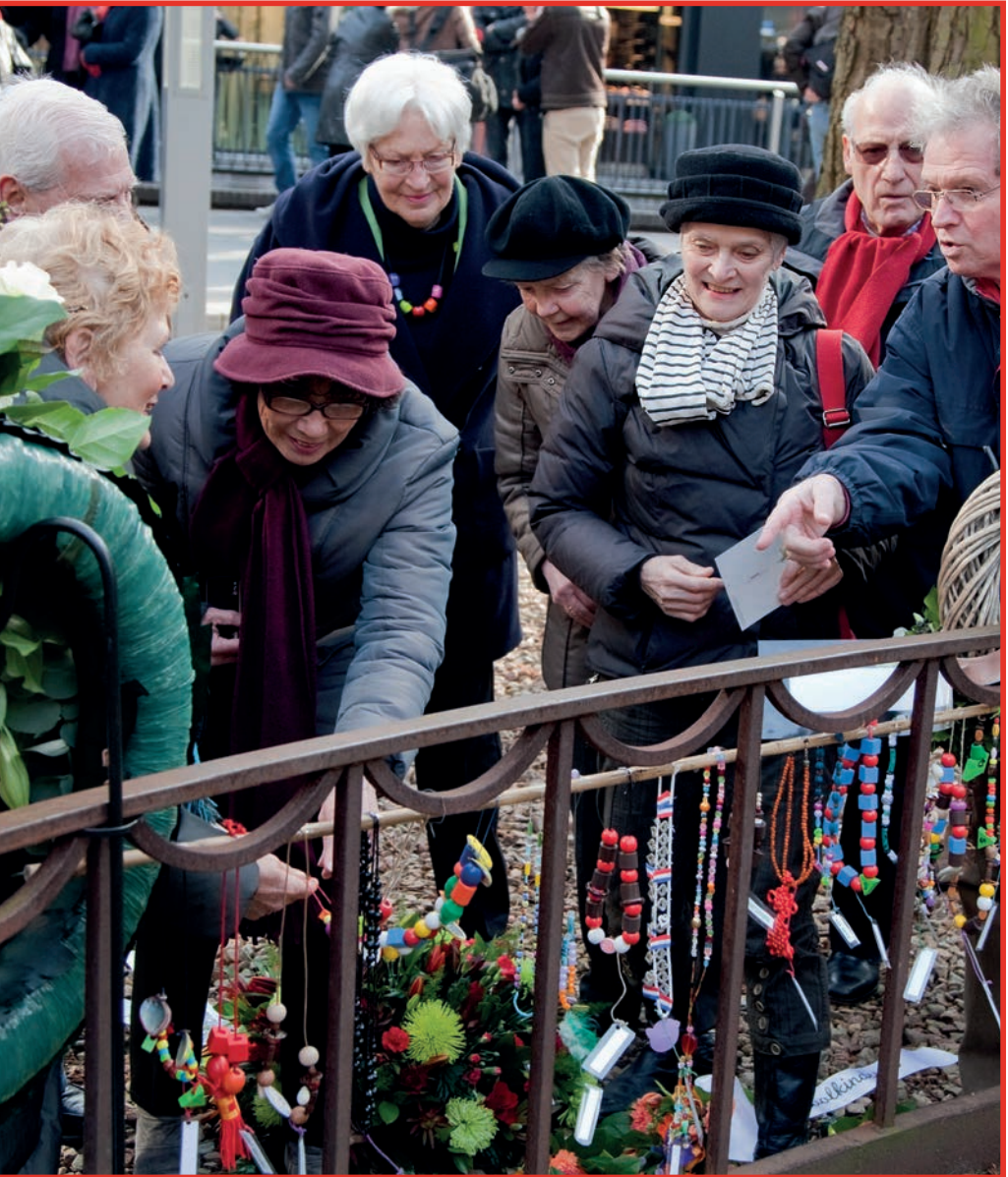
Nabestaanden bij de Schommel