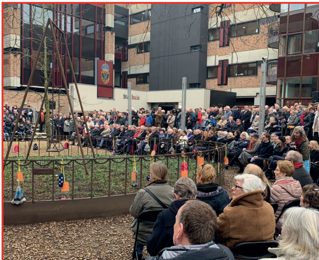
Herdenking bombardement op 22 februari bij de Schommel

Het is een bijzondere en zeldzame ervaring in het openbaar bestuur om vanaf een vaag idee tot feitelijke ingebruikname sturing te kunnen geven aan een plan, en dan is het wel heel bijzonder als het resultaat overtuigt en waardering krijgt. De voorgeschiedenis van de Schommel zit vol toevalligheden en persoonlijke keuzes die ook anders hadden kunnen uitpakken, maar het samenspel van locatie, aanleiding en inbedding maken van de Schommel een treffend monument dat direct tot het hart van velen spreekt en zo een belangrijke bijdrage levert aan het levend houden van de herinnering aan die rampzalige dag, 22 februari 1944.