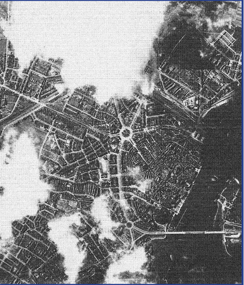
Nijmegen, seconden voor de inslag van de eerste bommen