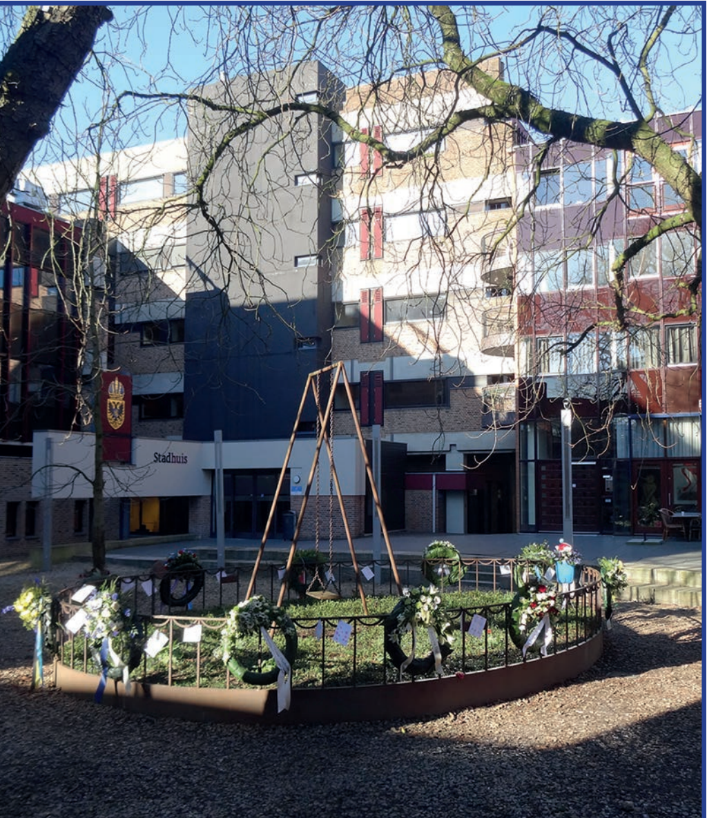
Kransen bij de Schommel, na een herdenking op 22 Februari